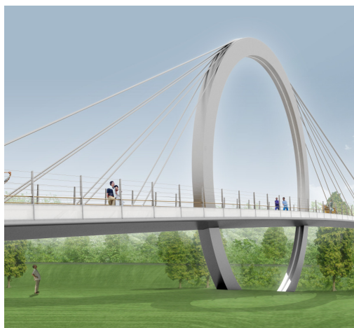
Illustrationer: Tim Nørlund (venstre), Dissing+Weitling (højre).