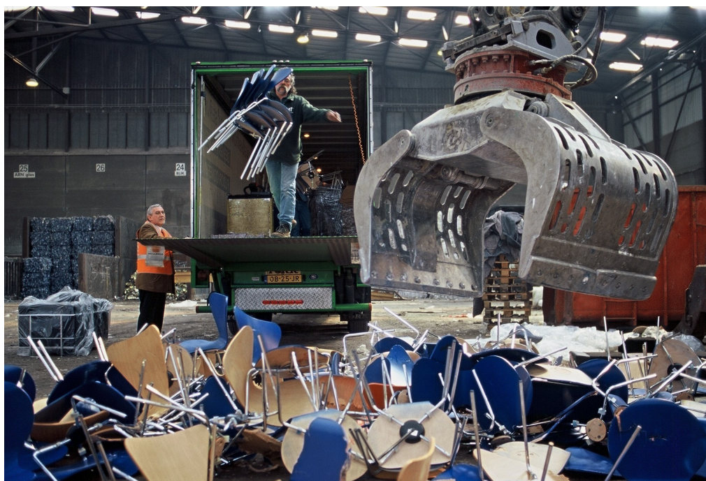
Kopier af stolen syveren, som Arne Jacobsen designede i 1955, destrueres