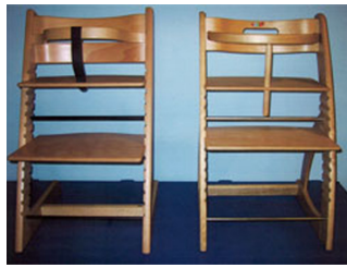
Thi kendes for ret: Tvilum Møbelfabrik A/S fik i 2001 af Højesteret forbud mod at markedsføre bamestolen ved navn 2-step (til højre på begge fotos). Ifølge dommen er stolen "en så nærgående efterligning, at den krænker den ophavsret, der er knyttet til Tripp Trapp-stolen."

"Ifølge skønsmændene kunne lægmænd – altså ikke-designere – forveksle de to stole. Højesteret forbød Tvilum Møbelfabrik at markedsføre 2-Step-stolen og beordre restlageret destrueret," fortæller Stina Teilmann.